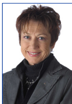
Evelyne RENOU Gouverneur

« Les jeunes sont notre bien le plus précieux, car ils représentent l'avenir du Rotary » !