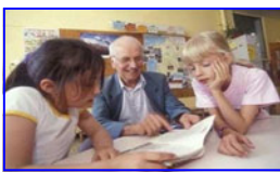
Les retraités rotariens peuvent aider les enfants en difficulté scolaire.

L'action « la plus fréquente », c'est l'organisation d'une « conférence » (25% des Clubs) car, pour agir utilement, il faut d'abord s'informer sur un sujet «tabou» et plein d'idées reçues. Ensuite, les « Dons », dons de livres, de fournitures scolaires, dons d'ordinateurs. Puis les « soutiens financiers » à des associations spécialisées (Type ApfEE : Coup de pouce CLE) ou bien à des associations pratiquant l'apprentissage du Français aux migrants. Par ailleurs, des Rotariens, ou des conjoints, font du « soutien scolaire bénévole et gratuit » dans certains Clubs.