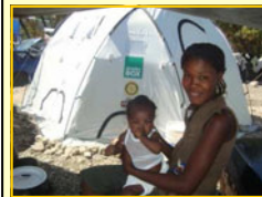
La vie reprend doucement à Haïti