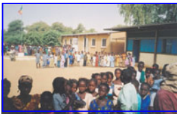
Contrairement à 75 millions d'enfants dans le monde, ces sénégalais de Ganguel Soulé ont la chance d'être scolarisés en primaire, mais dépourvus de matériel éducatif.

A la demande du Rotary International, j'ai effectué un recensement détaillé des actions des 88 Clubs du District dans le domaine de l'alphabétisation et de la lutte contre l'illettrisme. Le taux de réponse des Clubs est très fort (57%) ainsi que le nombre d'actions signalées : 164 au total soit 3,3 actions par Club. C'est une première conclusion très satisfaisante.