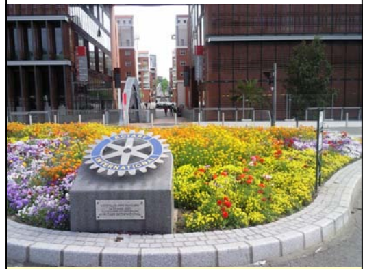
La Place du Rotary à Toulouse vit au rythme des saisons. Dès l'arrivée du printemps elle revêt ses habits de couleurs.