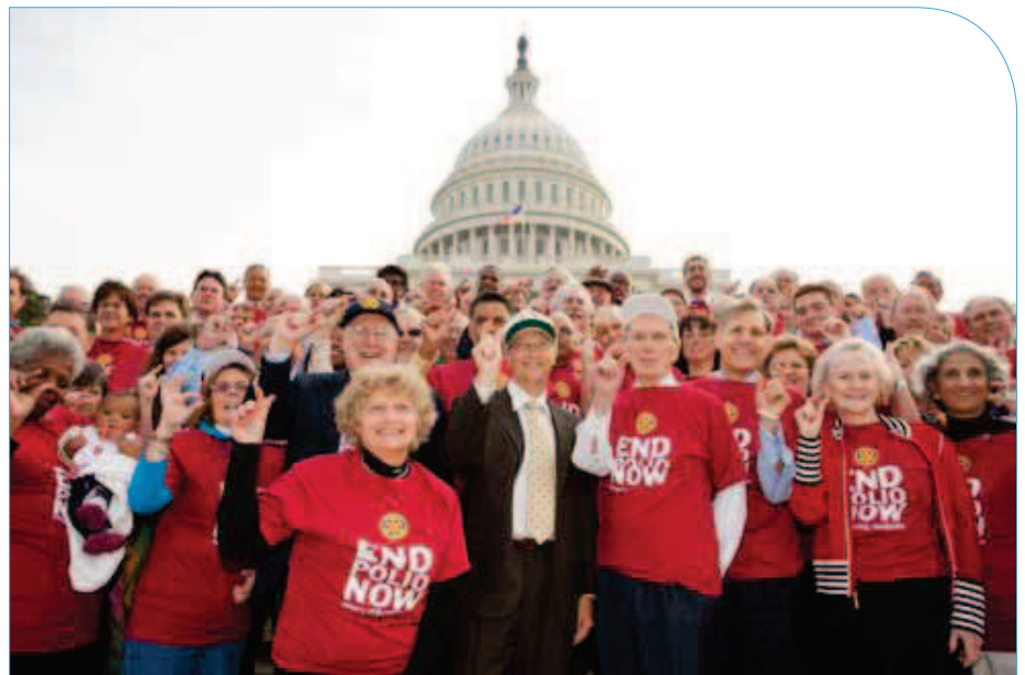
Bill Gates, co-président de la Fondation Bill & Melinda Gates, et des Rotariens font le geste « À ça » sur les marches du Capitole à Washington lors de la Journée mondiale contre la polio, le 24 octobre. La campagne « À ça » vise à promouvoir le message du Rotary : En finir avec la polio.

Recueillir 200 millions de dollars représente un tour de force pour le Rotary. Cependant, l'objectif reste la certification de l'éradication de la polio qui nécessite des fonds supplémentaires. Un déficit budgétaire menace les futures activités de vaccination contre la polio. Les pays donateurs doivent jouer un rôle majeur pour combler ce déficit et les Rotariens vont intensifier leurs démarches auprès de leurs gouvernements respectifs. Il est également essentiel que les Rotariens continuent de verser des dons au Défi du Rotary jusqu'au 30 juin 2012.